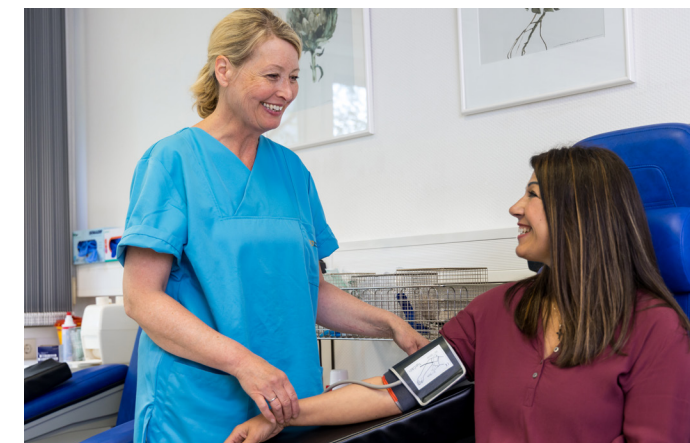
Pflegerische Betreuung durch eine zertifizierte Hämophilie-Assistentin.

Durch das Zentralinstitut für Laboratoriumsmedizin am Universitätsklinikum Düsseldorf erfolgen alle notwendigen laborapparativen Untersuchungen der speziellen Gerinnungsdiagnostik (Hämostaseologie) mittels modernster technischer Ausstattung und innerhalb kürzester Zeit. Insbesondere Messergebnisse aus der Bestimmung von Einzelfaktoren (vor allem Faktor VIII und IX und die von-Willebrand-Parameter) liegen uns tagesaktuell binnen weniger Stunden vor. Damit können wir Sie stets schnellstmöglich und zuverlässig über Ihre Untersuchungsergebnisse informieren und beraten.