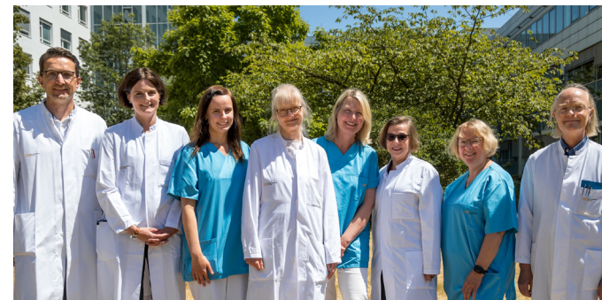
Ihr Team der Hämophilie-Ambulanz

Ärztliche Leitung Hämophilie-Ambulanz, UKD-Bereich