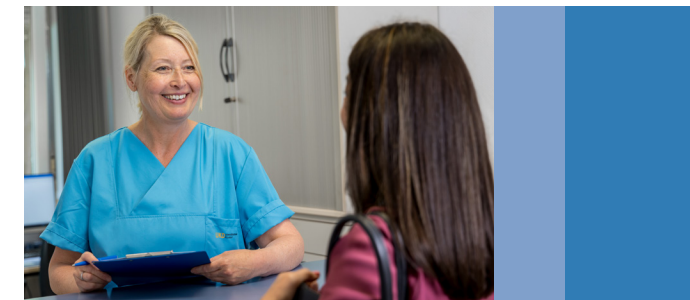
Wir nehmen uns Zeit für Ihre Anliegen.

Zur persönlichen Therapiesteuerung bieten wir Ihnen eine spezielle Hämophilie-App an, welche Ihnen einen besonderen Komfort bei der Dokumentation des Behandlungsverlaufes und in der Kommunikation mit uns ermöglicht.