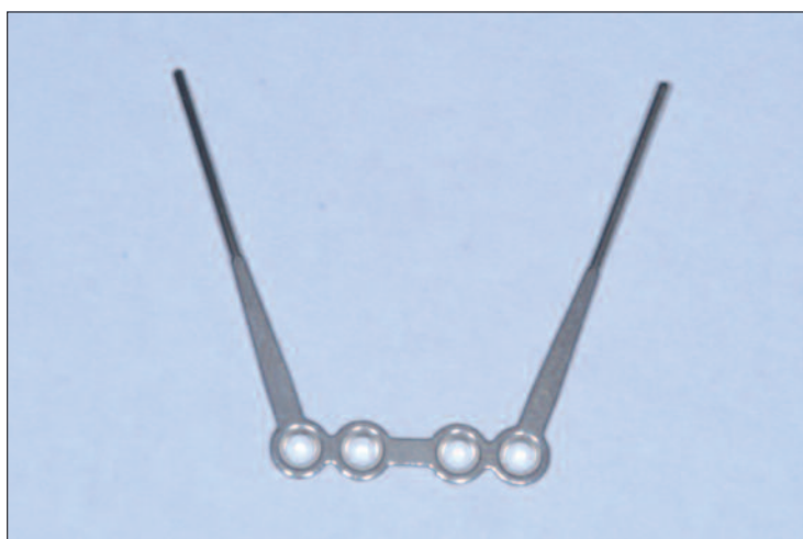
Abb. 1: Mentoplate (Fa. Promedia)