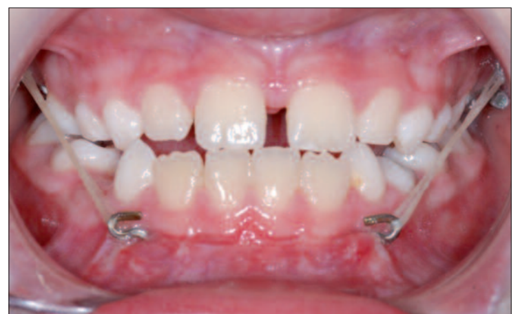
Abb. 3: Intraorale Situation mit intermaxillären Gummizügen. Das Tragen der unbeliebten Gesichtsmaske ist nicht mehr erforderlich, vielmehr wird eine 24-stündige Kraftapplikation bei relativ hohem Patientenkomfort ermöglicht.