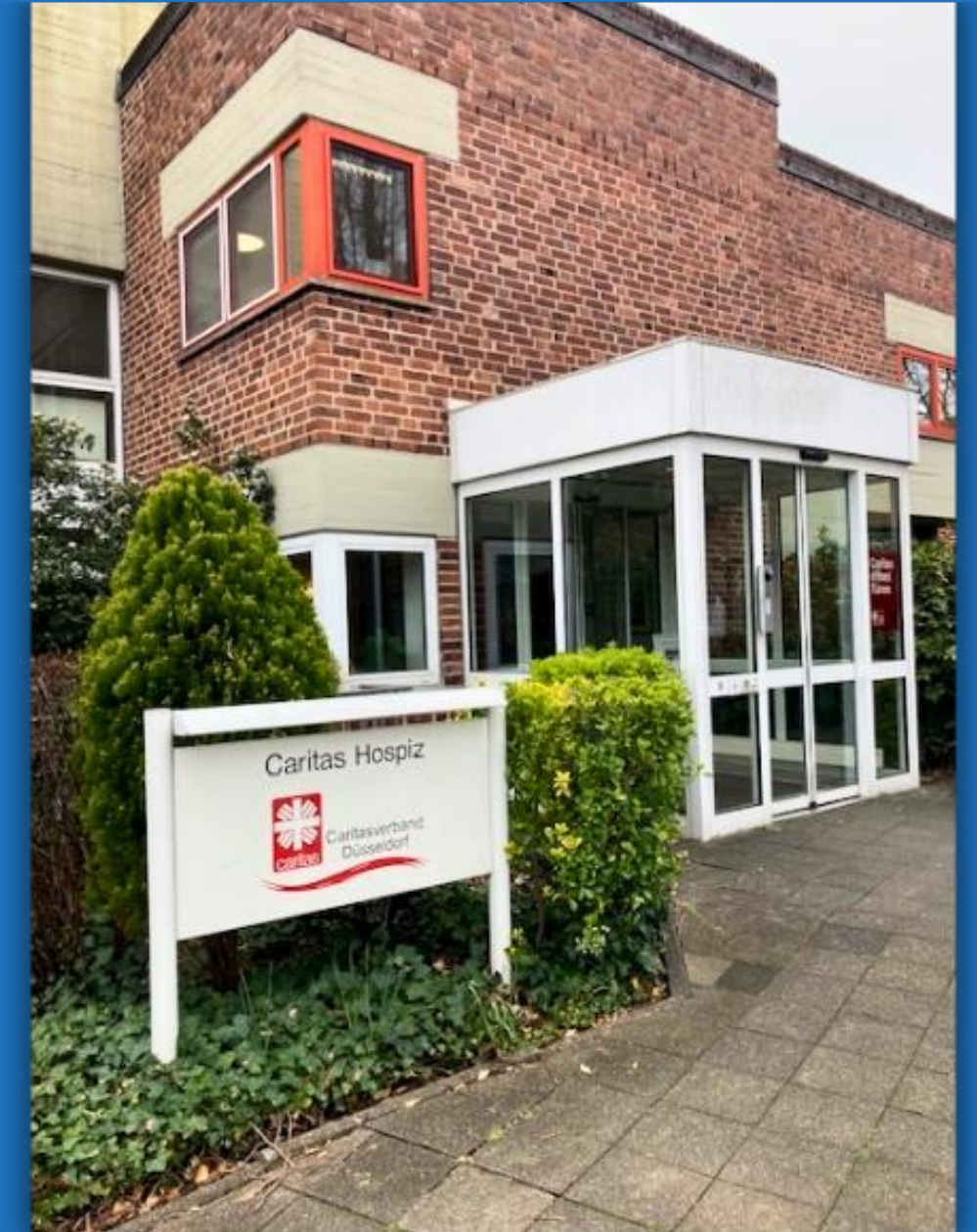
Caritas Hospiz Garath