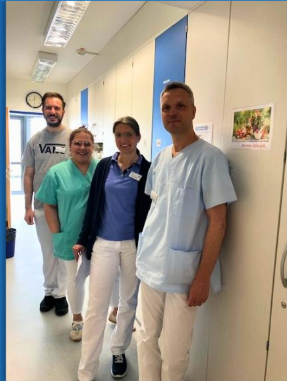
Hospiz am EVK