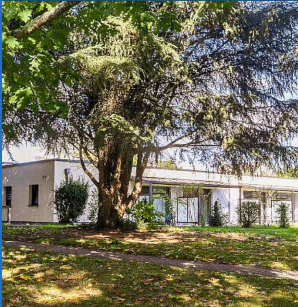
Friedericke Fliedner Hospiz Kaiserswerth