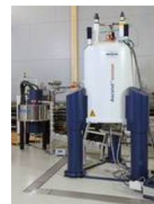
DNP-verstärktes Hochfeld-NMR-Spektrometers

Mithilfe eines neuartigen DNP-verstärkten Hochfeld-NMR-Spektrometers gelang es den Forschern zum ersten Mal, die Signale eines ausgewählten Proteins direkt in einer aus Bakterienzellen gewonnener Lösung zu messen. DNP steht für Dynamic Nuclear Polarization. Das Gerät wurde durch Prof. Dr. Henrike Heise (HHU, Institut für Physikalische Biologie) bei der Deutschen Forschungsgemeinschaft eingeworben und 2014 im Biomolekularen NMR-Zentrum der HHU und des Forschungszentrums Jülich in Betrieb genommen.